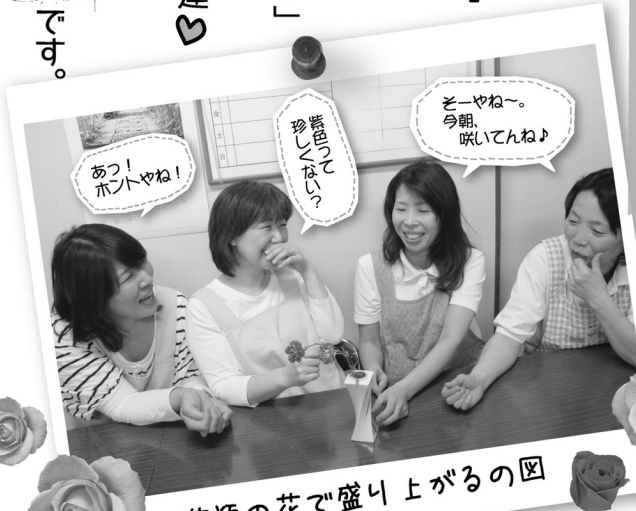
花瓶の花で盛り上がるの図

毎朝、元気なあいさつとともに スタッフの一日がはじまります。 その朝礼の主役は「花」 花瓶にいけられた花を見て 朝礼前の何気ないひととき♪ みんなで、その花について 「色がどうか、咲き始めたとか…」 いろんな事を言い合います。 花が好きで優しい桜井の仲間達 でも、仕事に対しては みんな厳しくて、団結すると すごい力を発揮するプロ集団 です。